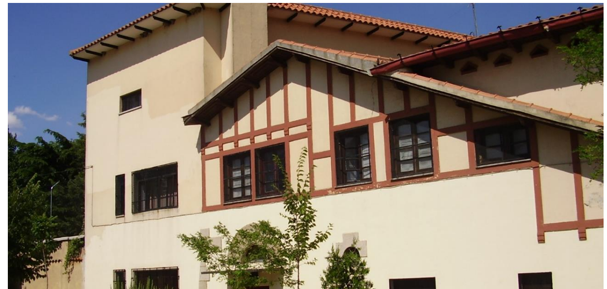
Centro de acogida Padre Damián