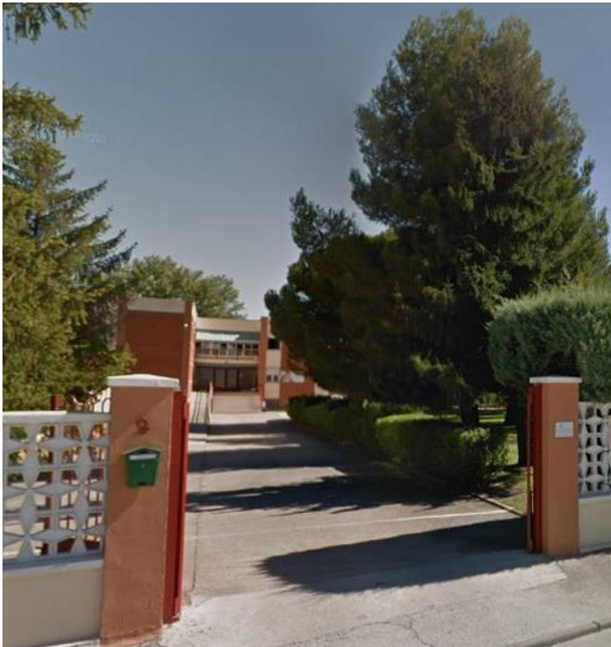
Centro materno infantil “Ave María”