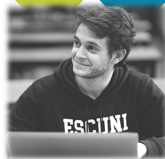
MAESTRO EN EDUCACIÓN PRIMARIA