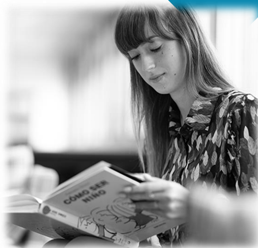
MAESTRA EN EDUCACIÓN INFANTIL